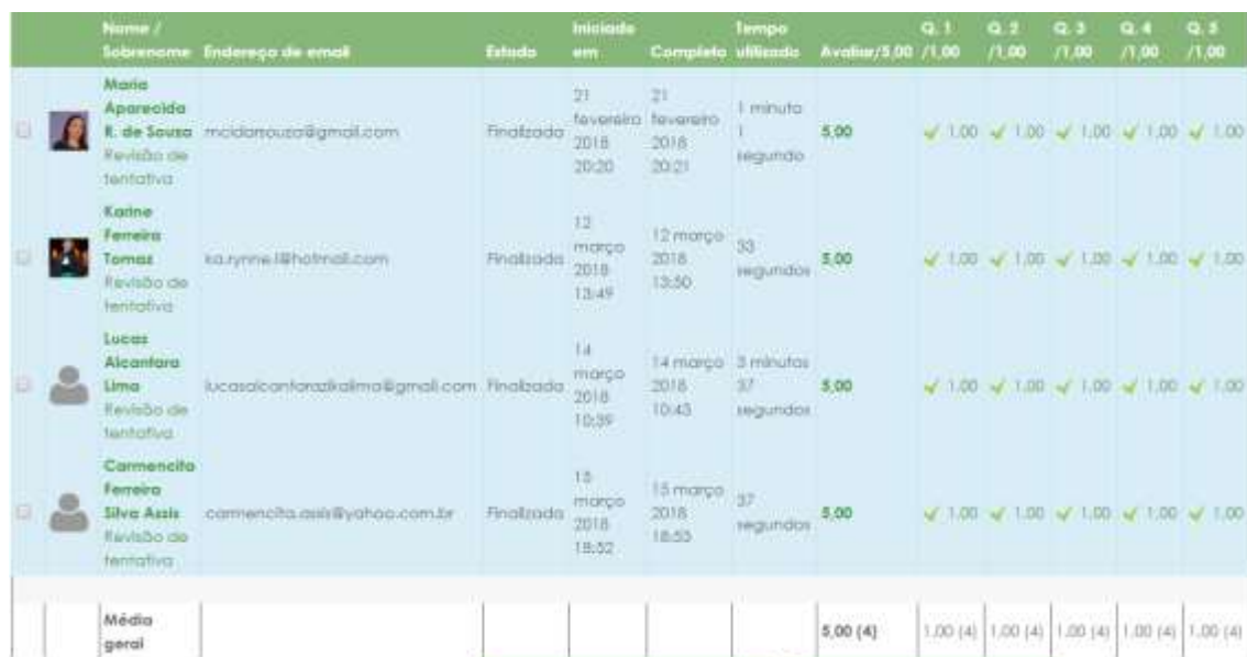
Figura 8: Avaliação do curso

Por meio de mensagens, tivemos também um feedback do desenvolvimento do curso por parte de cursistas: