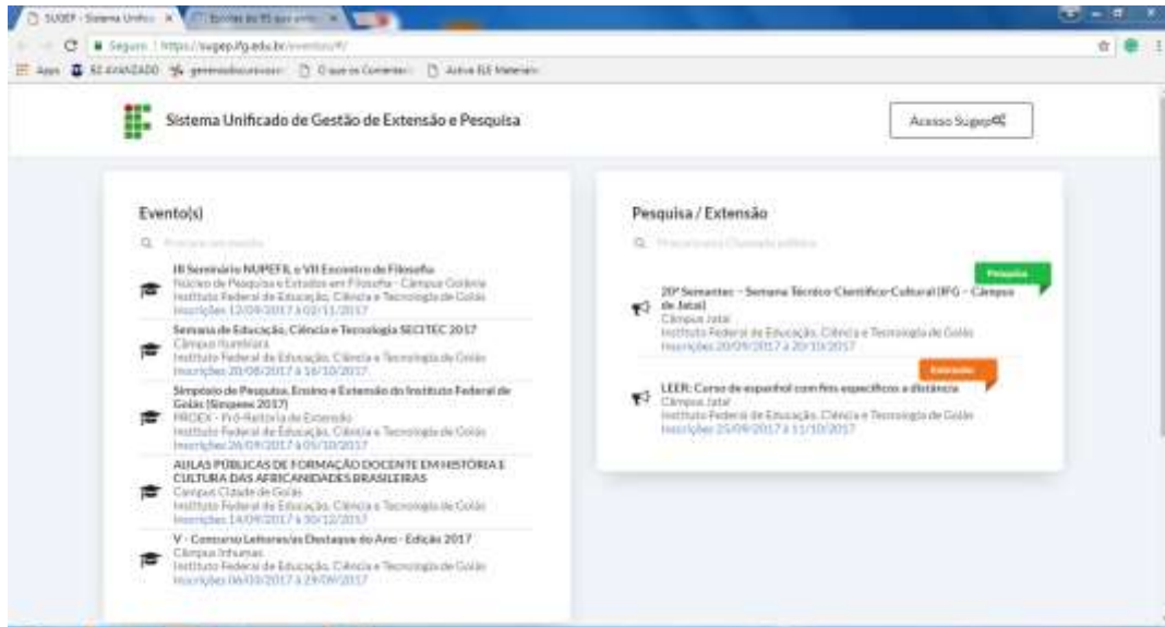
Figura 3: Página inicial do SUGEP