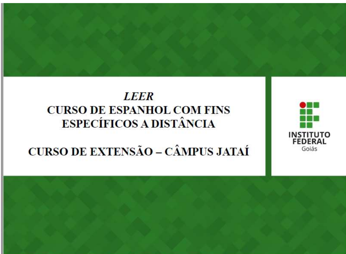
Figura 6: Página inicial dos slides : LEER – Curso de Espanhol com fins específicos a distância

Na aula presencial, estiveram presentes todos os membros da equipe. Cada um expôs sobre sua função no LEER. A presença dos/das cursistas não foi obrigatória uma vez que temos cursistas residentes em outras cidades, Inhumas-GO e Goiânia-GO, por exemplo. Apresentamos slides explicativos e informativos sobre o curso. A metodologia foi de exposição dialogada, à medida que os/as cursistas apresentavam dúvidas, procuramos saná-las. Seguem slides ilustrativos: