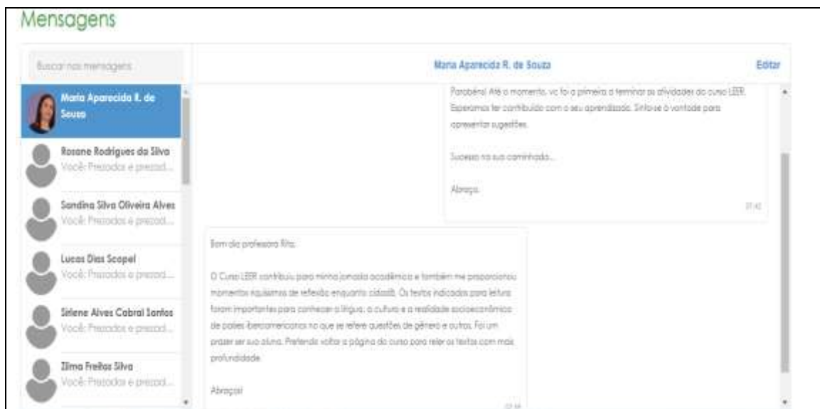
Figura 9: Comentário discente sobre a participação no curso